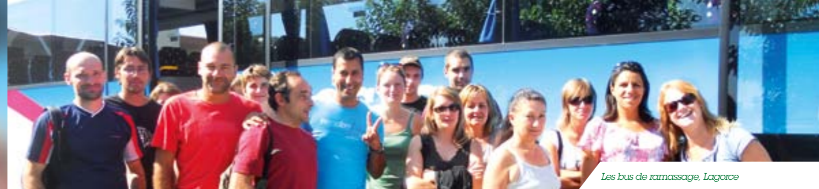
Les bus de ramassage, Lagorce

Des investissements importants en matériel et en formation des collaborateurs ont été réalisés pour développer la visio-conférence et le travail collaboratif à distance : tous les collaborateurs ont aujourd'hui accès à ces nouveaux services via leurs postes individuels ou en disposant de salles de réunions équipées de visio-conférence. Ces nouvelles pratiques permettent de réduire drastiquement le nombre de déplacements professionnels et donc leur impact environnemental.