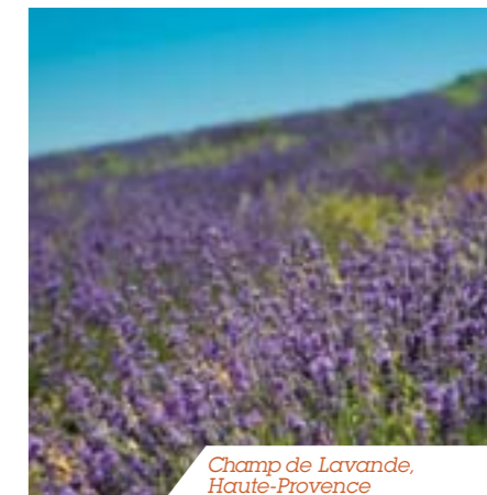
Champ de Lavande, Haute-Provence

de la déforestation en Asie du sud-est. Nous n'achetons pas d'huile de palme en direct mais nous nous approvisionnons en matières premières en comportant, tels que les copeaux de savon.