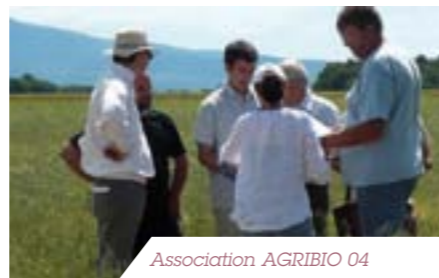
Association AGRIBIO 04

ENCOURAGER L'AGRICULTURE BIOLOGIQUE AGRIBIO 04 est une association qui rassemble les producteurs bio des Alpes de Haute-Provence et qui œuvre pour le développement et la défense de l'agriculture biologique. L'OCCITANE soutient l'association en finançant une partie du projet « Objectif Bio 2013 » qui a pour but d'atteindre 20% des surfaces cultivées en bio d'ici 2013 et de faire des Alpes de Haute-Provence le 1 er département BIO de France.