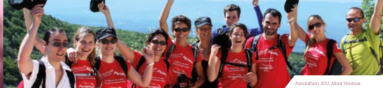
Pandathlon 2011, Mont Ventoux

« L'entreprise grandit et afin de garder des racines profondes et des salariés motivés par les valeurs de la marque, nous continuons à nous ancrer dans les territoires et communautés qui nous entourent.