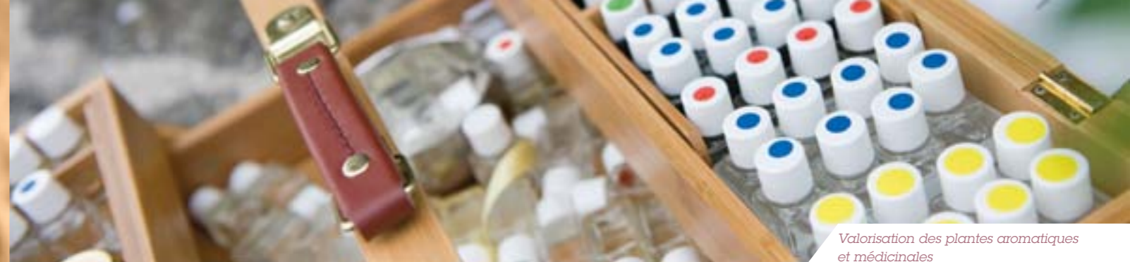
Valorisation des plantes aromatiques et médicinales