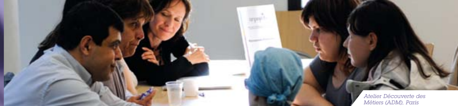
Atelier Découverte des Métiers (ADM), Paris