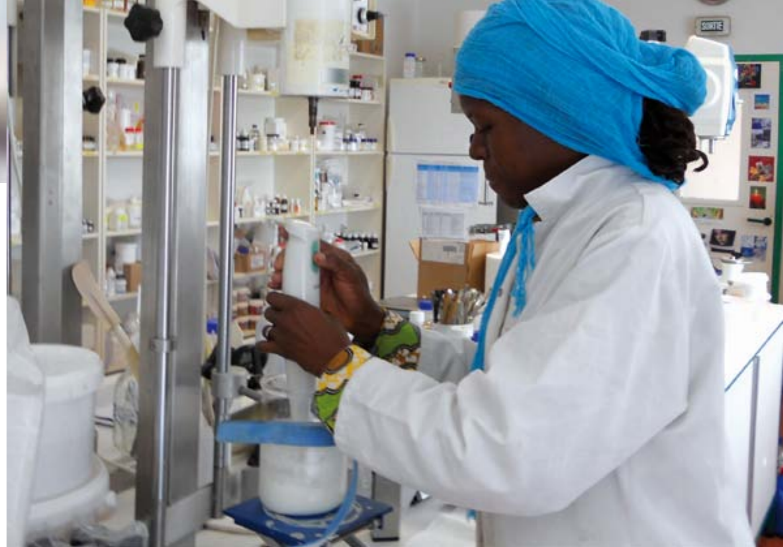
Barkissa en compagnonnage industrielle à Lagorce