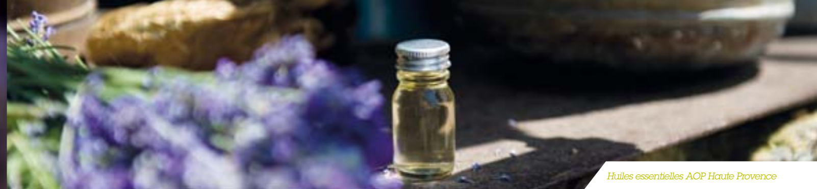
Huiles essentielles AOP Haute Provence

LES LABORATOIRES opérant pour le compte des autorités chinoises viennent de mettre en œuvre un programme d'étude visant à élaborer un nouveau protocole de soin alternatif. L'OCCITANE continuera d'œuvrer activement à ce que ces tests soient mis en pratique le plus rapidement possible.