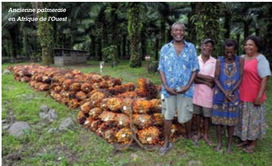
Ancienne palmeraie en Afrique de l'Ouest

* RSPO : association à but non lucratif qui réunit tous les acteurs de la filière (planteurs, transformateurs, industriels, banques, ONG) en vue d'élaborer et de mettre en place des critères internationaux pour la certification de l'huile de palme durable.