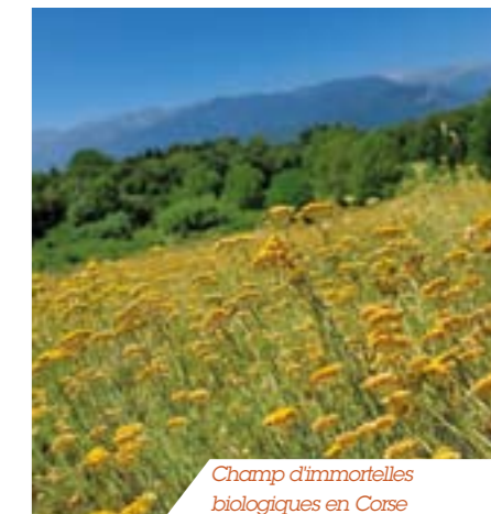
Champ d'immortelles biologiques en Corse

Cette année, des essais de micro-distillation sont menés pour récolter aux meilleurs moments afin de préserver toute la richesse de la plante et garantir une excellente repousse les années suivantes.