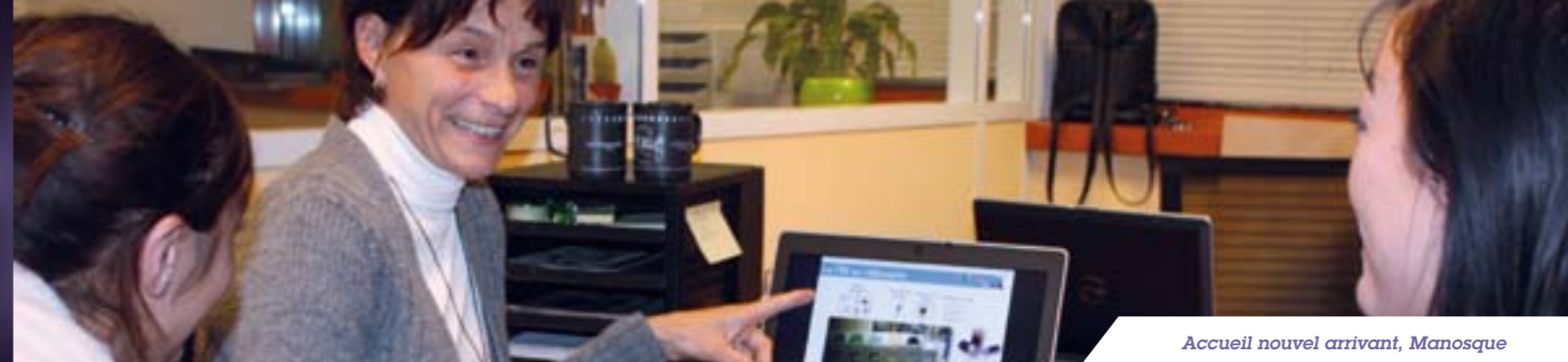
Accueil nouvel arrivant, Manosque