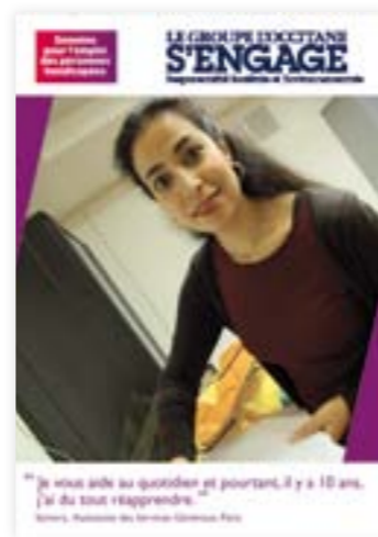
Une exposition photo impliquant des salariés en situation de handicap

SUITE À CE CAFÉ DÉBAT, nous avons réalisé avec ces personnes plusieurs vidéos afin d'initier l'ensemble des salariés du site à l'apprentissage de la Langue des Signes. Nous vous invitons d'ailleurs à demander à un de nos salariés de vous dire bonjour en LSF !