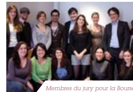
Membres du jury pour la Bourse

Créée en 2006, la Fondation L'OCCITANE dispose d'un budget annuel moyen d'un million d'euros et supporte une quinzaine d'associations.