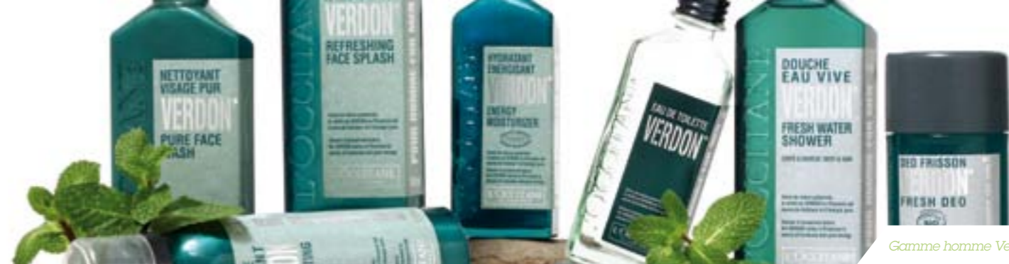
Gamme homme Verdon