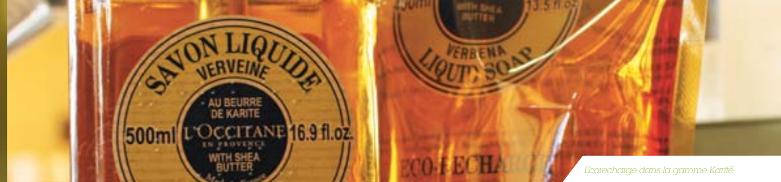
Eco-recharge dans la gamme Karité

AROMACHOLOGIE L'OCCITANE intègre des matériaux recyclés dès que cela est possible. Dans les lignes de soins capillaires, les flacons des shampooings, après-shampooings et masques sont élaborés dans des plastiques PET 100% recyclés et recyclables. De plus cette année, les tubes de la ligne Eclat & Soins Couleur sont également en plastique partiellement recyclé (le 100% recyclé ne permettant pas une protection optimum de la formule).