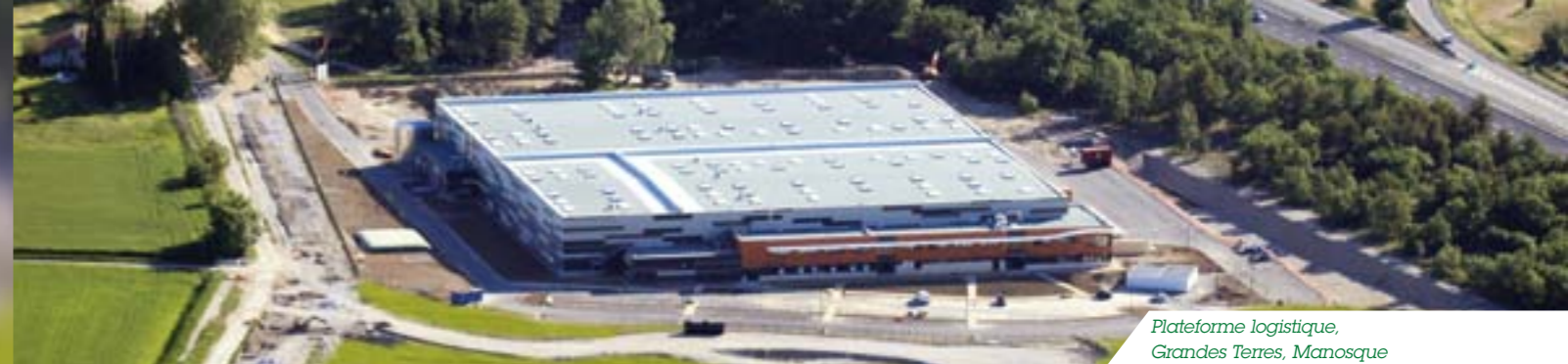
Plateforme logistique, Grandes Terres, Manosque

« Plus de 200 millions de produits du Groupe L'Occitane transitent par la plateforme de Grandes Terres à Manosque pour être ensuite livrés à tous nos clients dans le monde chaque année. Maitriser les impacts sur l'environnement des toutes nos activités logistiques ce n'est pas seulement une évidence, mais un impératif pour une société. »