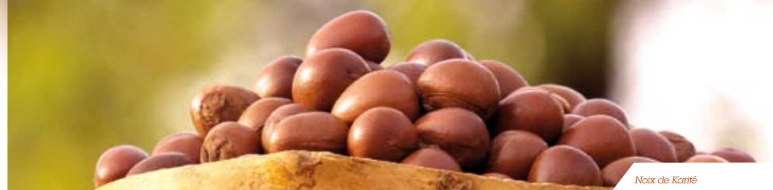
Noix de Karité