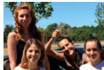
Les gagnantes de juin pour le co-voiturage

visant à réduire le recours à la voiture individuelle dans les déplacements Domicile-Travail, avec deux axes principaux LE CO-VOITURAGE : les mesures incitatives se multiplient d'année en année pour motiver un nombre croissant de salariés à partager leur véhicule pour venir travailler :