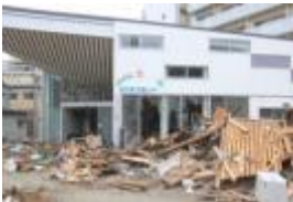
Le centre de Kaimashi après le séisme

A la suite de la catastrophe, 50 000 produits L'OCCITANE ont été distribués par les employés japonais aux victimes dans les centres d'urgence. De cette façon, les employés de L'OCCITANE ont pu permettre aux victimes du tremblement de terre de disposer des éléments de confort et d'hygiène essentiels.