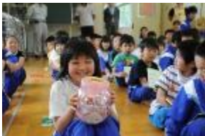
Les enfants du centre de Kaimashi