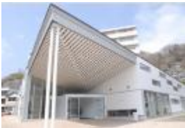
Le centre de Kaimashi après la reconstruction